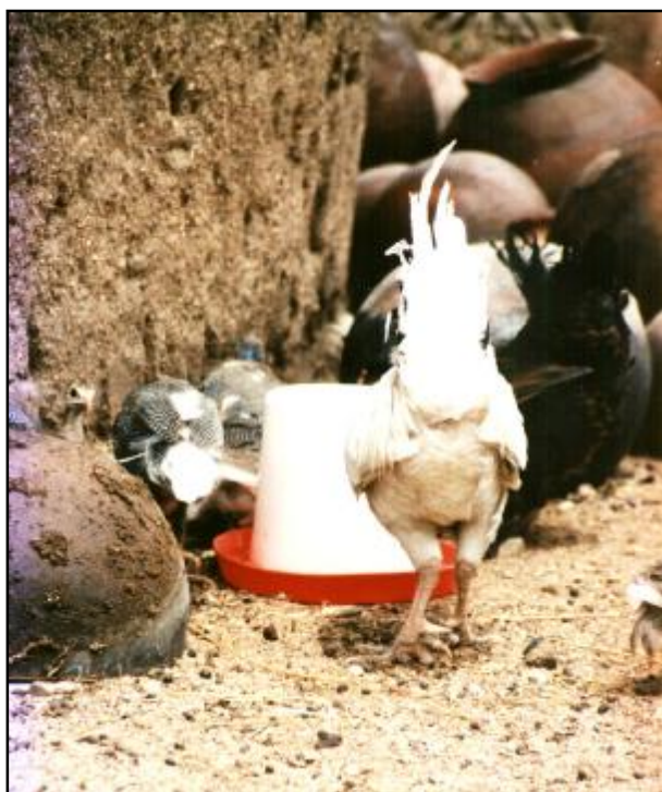
L'abreuvoir est testé.