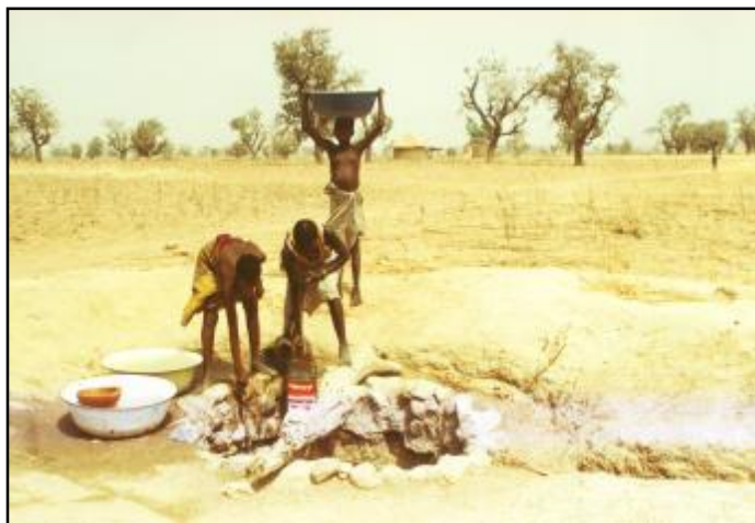
Un trou qui donne de l'eau potable?

L a construction des puits à grand diamètre a connu une évolution éclatante pendant ces dernières années.